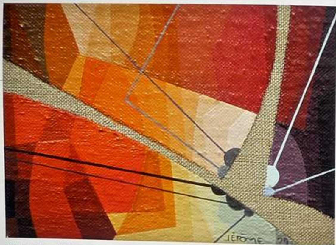
JEAN-PAUL JÉRÔME • Meulière • Acrylique / Acrylic • 7,8 x 11 cm

De son vivant, Jean-Paul Jérôme n'a certainement pas reçu tout le mérite qui lui était dû pour sa peinture, mais au fil des années, ce signataire du manifeste des Plasticiens se fera redécouvrir tout simplement parce qu'il est impossible de passer à côté d'un œuvre aussi colossal. Curieux, insatiable et travailleur, il aura été jusqu'à la fin un créateur accompli.