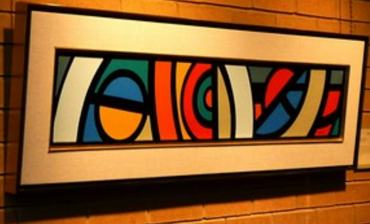
Wynne's Sculpture Wynne's Sculpture Wynne's Sculpture