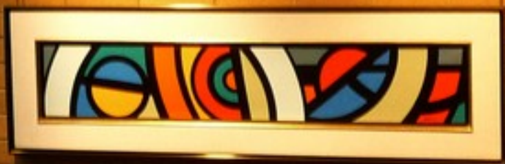
Small white rectangular label with illegible text.