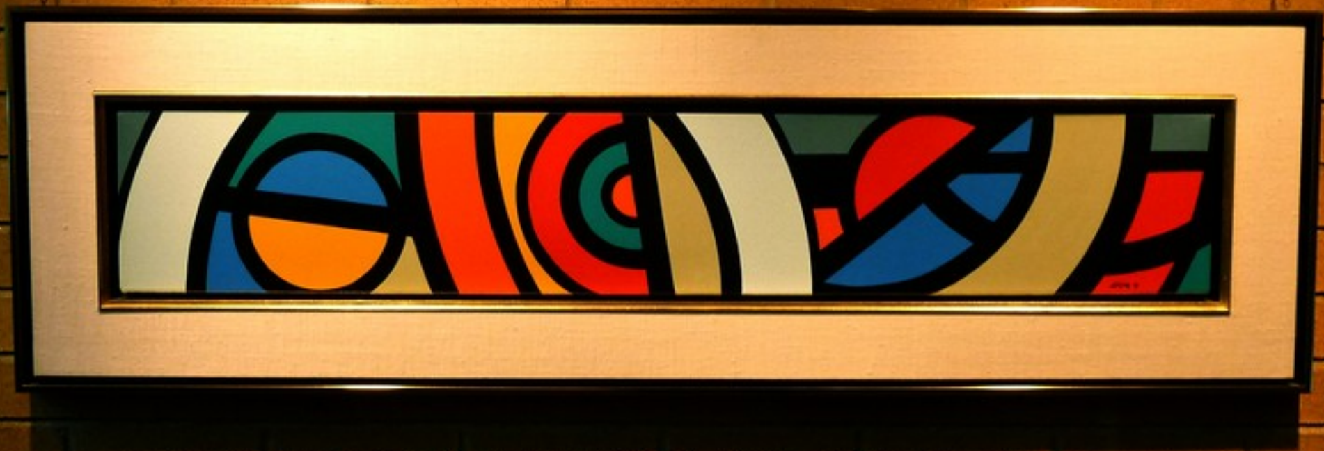
Alan Paul Wilson 1974 Alan Paul Wilson, "Abstract", 1974. Acrylic on canvas. 10 1/2 x 48 1/2 inches. Gift of the artist to the University of California, San Diego. UCSD Art Collection.