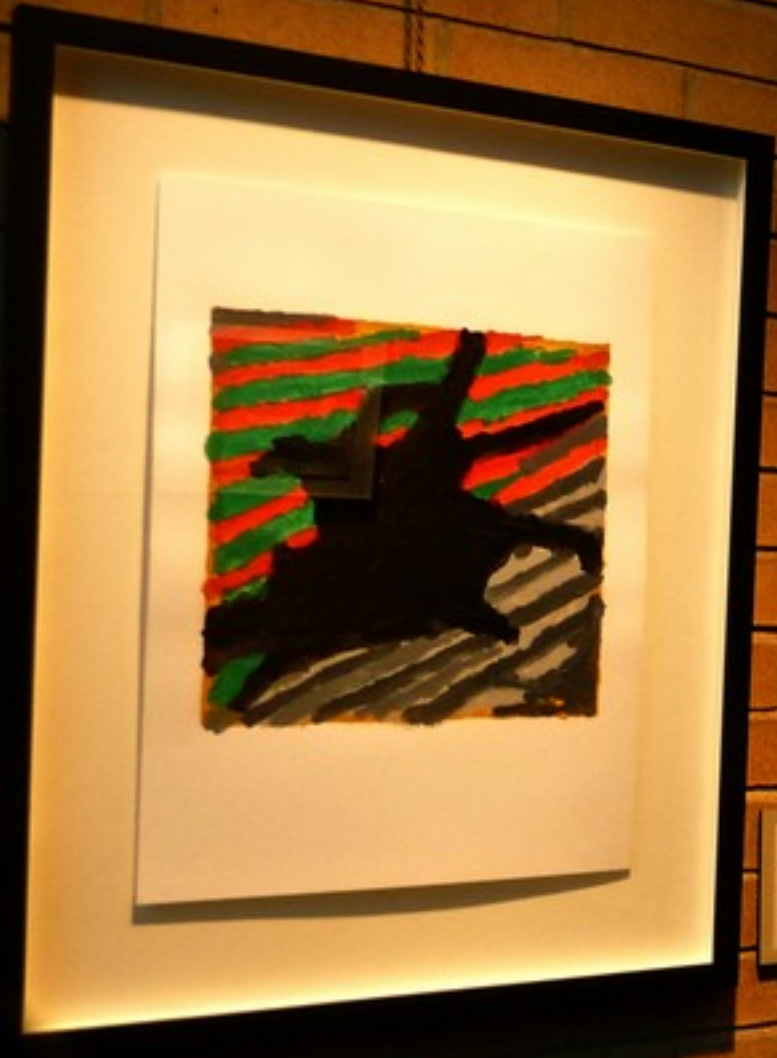
Wynne's Sculpture Wynne's Sculpture Wynne's Sculpture