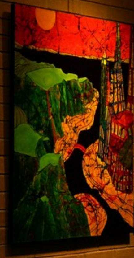
Abstract artwork by [Artist Name]