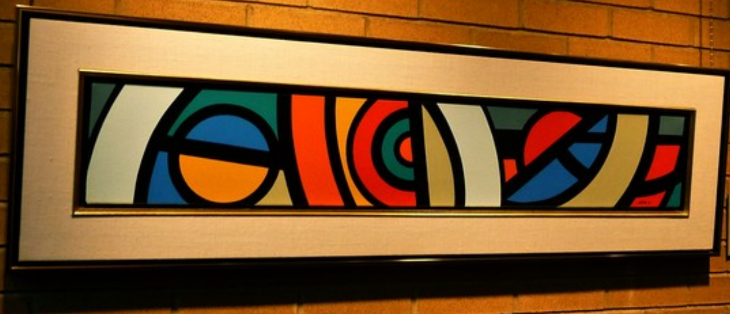
Abstract artwork by [Artist Name]