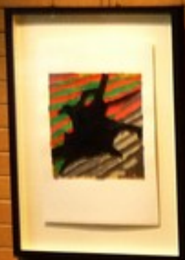
Small white rectangular label with illegible text.