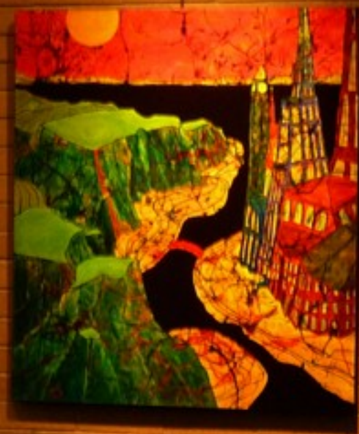
Small white rectangular label with illegible text.