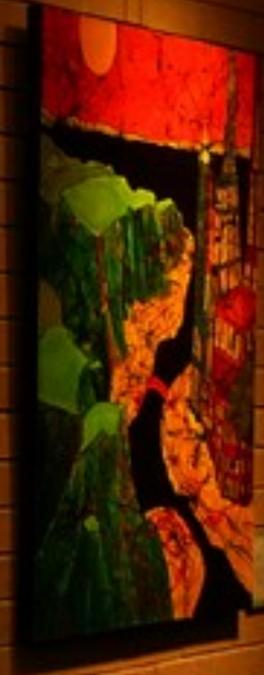
Wynne's Sculpture Wynne's Sculpture Wynne's Sculpture